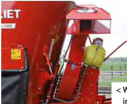
< Wasserdüse im Gebläseaustrag