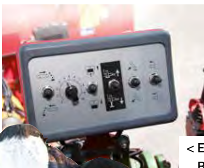
< Elektrische Bedienung