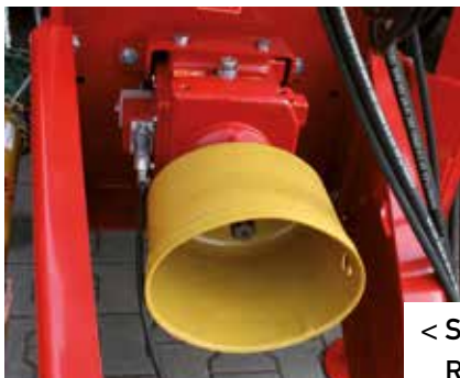
< Schaltbares Reduziergetriebe