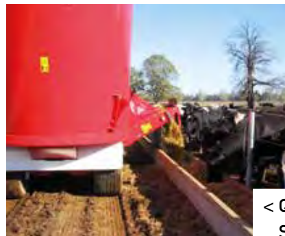
< Querförderkette für Solomix ZK