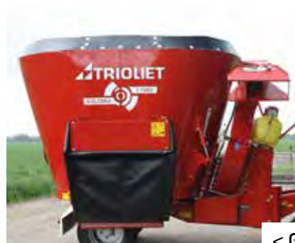
< Gummi Überlaufing