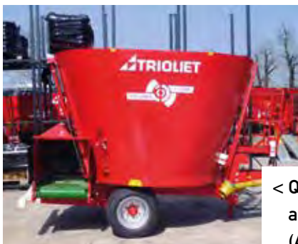
< Querförderband an der hinterseite (ALH-B)